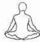
Upaviṣṭha Virāsana I