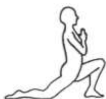
Eka Pāda Rājapotaśana II