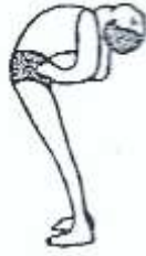
Going down to Urdhva Dhanurāsana