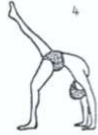
Eka pada Urdhva Dhanurāsana I