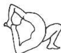
Eka Pāda Rājapotaśana II