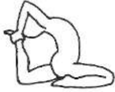
Eka Pada Rajakapotasana III