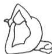
Eka Pāda Rājapotaśana I