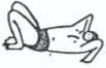
pushing up to Urdhva Dhanurāsana