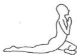
Eka Pāda Rājapotaśana I