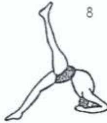
Eka pada Viparīta Dandāsana I